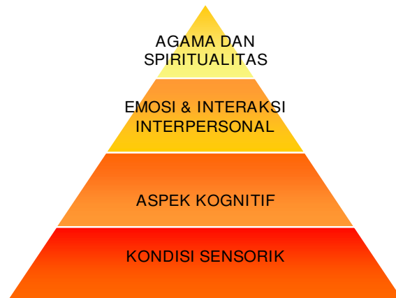
Gambar 2 Taraf-teraf dalam Kehidupan Individu SA

Untuk memperbanyak atau mengutip tulisan ini, harus seijin Penulis